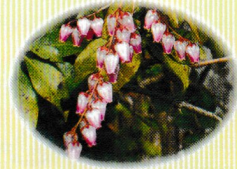
アセビ (花期：3～4月中旬) 春先に可愛らしい花を鈴なりに咲かせます。特にながめの道沿いで鑑賞できます。