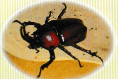
カブトムシ (活動期：7～9月頃) 言わずと知れた昆虫の王様です。人里近くの雑木林、特にクヌギの樹液によく集まってきます。