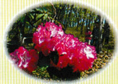
シャクナゲ (花期：4～5月中旬) 公園内各所で咲きますが、特にシャクナゲ園での咲き乱れは見事です。