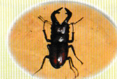
ノキギリクワガタ (活動期：7～9月頃) カブトムシと双璧をなす昆虫界の人気者です。幼虫時の栄養によって、アゴの大きさ・形が変わってきます。