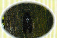
アブラゼミ (活動期：7～9月頃) 昆虫界屈指の音量を誇る夏の代表者です。その声は一段と夏の暑さを増してくれます。