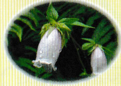
ホタルブクロ (花期：6～7月頃) 梅雨～初夏にかけて咲きます。虫を中に入れて遊んだ事からこの名がつけられたと言われています。