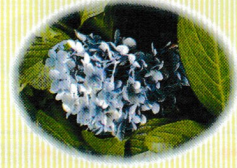
アジサイ (花期：6～7月頃) カタツムリ&雨との共演が良く似合う花です。森のアトリエ近くの階段沿いが絶好の鑑賞場です。