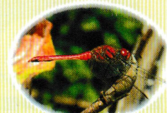
ナツアカネ (活動期：7～11月頃) 平地から丘陵地にかけて広く見られます。未熟期には雌雄とも黄褐色をしています。が、成熟した雄は全身が赤くなります。